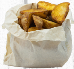
POMMES DE TERRE RUSTIQUES