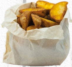
POMMES DE TERRE RUSTIQUES